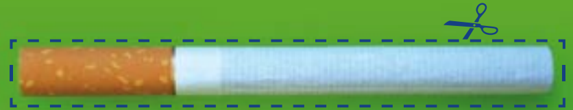
يارمه تيب ته دین تا بيهه ستييت